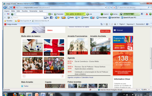
Figura 2: Site do Colégio Arnaldo.